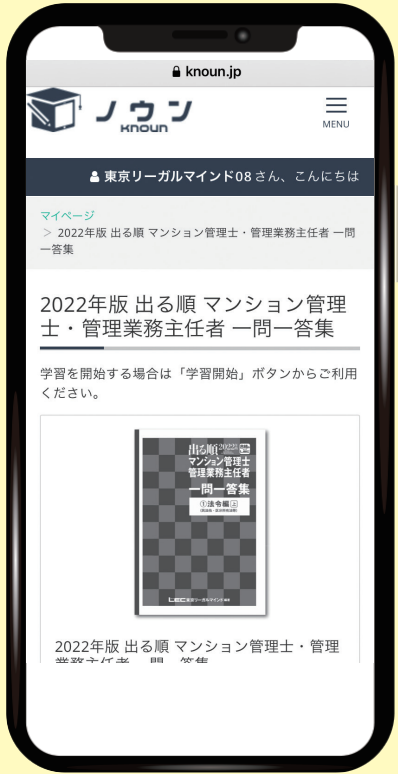
※画面は2022年版一問一答集の見本です